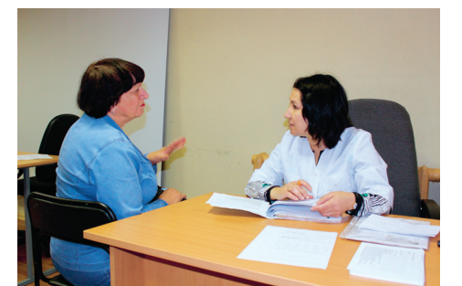
Акция «Диспансеризация рядом с домом»

Органы местного самоуправления Муниципального образования Лиговка-Ямская плодотворно сотрудничают с СПб ГБУЗ «Городская поликлиника № 38», в результате чего в сентябре стало возможным проведение акции «Диспансеризация рядом с домом», реализуемой в рамках программы «Медицина шаговой доступности». Мобильная поликлиника работала в административном здании на улице Харьковской, дом 6/1. Подобных мероприятий на территории Центрального района ранее не проводилось,